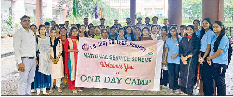
पानीपत। आईबी पीजी कॉलेज में एनएसएस के स्वयं सेवी विद्यार्थी देश भक्ति के गीत गाते हुए।