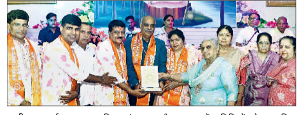
पानीपत। आर्य समाज गुरु विरजानंद भवन खेल बाजार में अतिथियों को सम्मानित करते हुए मेजबान।