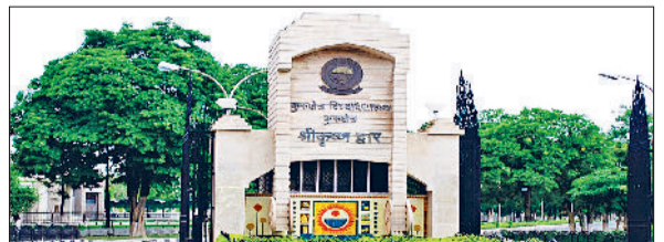
कुरुक्षेत्र। कुरुक्षेत्र विश्वविद्यालय का बाहरी दृश्य।