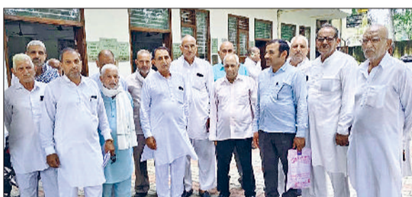
करनाल। इंद्री में हुई मासिक मीटिंग में पहुंचे नंबरदार।