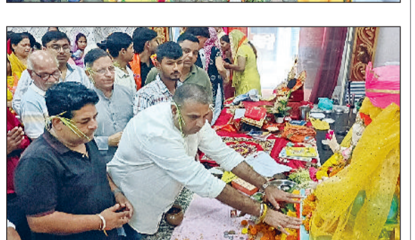
घरौडा। भगवान गणेश का विधिविधान से पूजा-अर्चना करते भक्तगण।